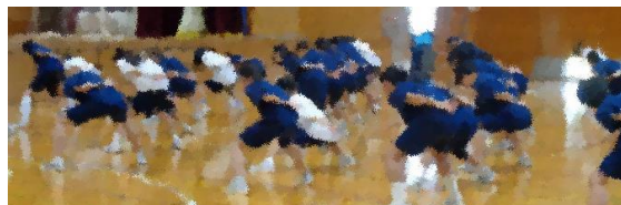
ポイントを丁寧に練習